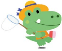
☆えいごであそぼう