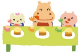
☆あかちゃん絵本読み聞かせ