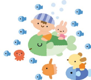
♡20日 おしゃべりサロン

広場を大きく使用してゆったりとマッサージを行いました。寝つきがちょっと…と言っていたお子さんもすやすやと眠っていましたよ!