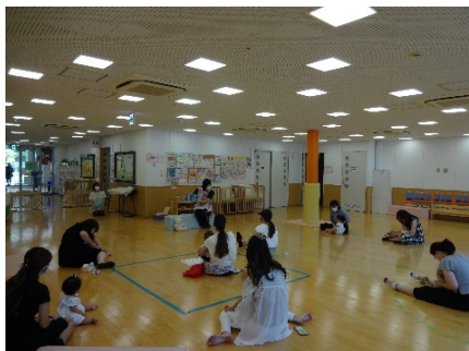
♡3日 プチ絵本の読み聞かせ